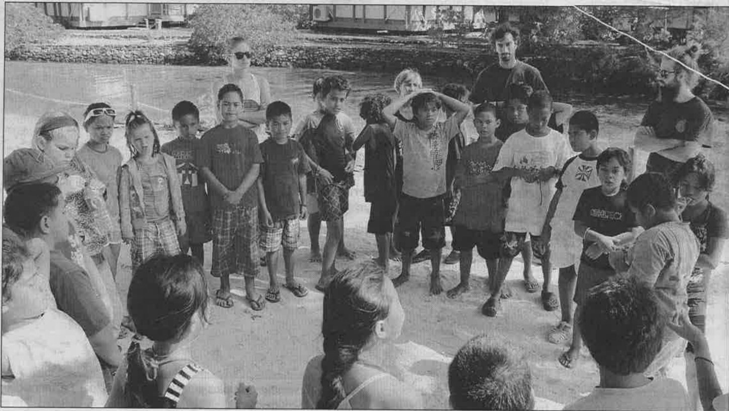
Une trentaine d'enfants de la saga ont visité le Moorea Dolphin centre et ont fait connaissance avec Lokahi.